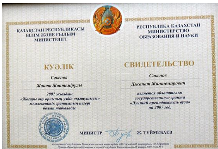
Лучший преподаватель вуза за 2007 год

– Педагогические основы полового воспитания в условиях непрерывного образования: учебное пособие. – Павлодар: ПГПИ, 2014. – 190 с. [10].