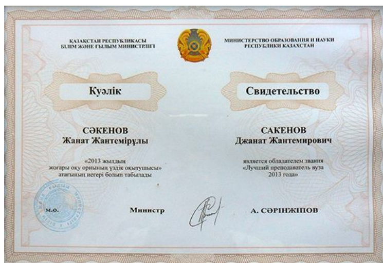
Лучший преподаватель вуза за 2013 год

– Preparation of students of higher education institution for professional activity in the course of studying of pedagogical disciplines. World Applied Sciences Journal, 2012, 19 (10), p. 1431-1436. [16].