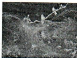
Сурет 1 – Аталуы (12 pt)

Баяндама мәтіні. Баяндама мәтіні. Баяндама мәтіні. (14 pt)