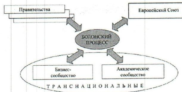
Рисунок 1 – Название рисунка

Текст доклада Текст доклада Текст доклада Текст доклада Текст доклада [1].